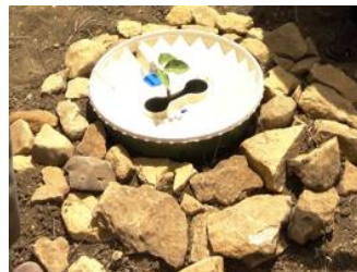
27. Als u stenen beschikbaar heeft, bedek de grond