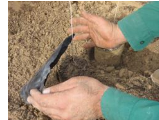
19. Neem tijdens het planten het plastic af