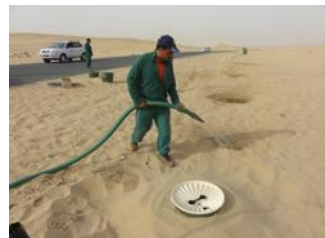
28. Dan begint u met water geven