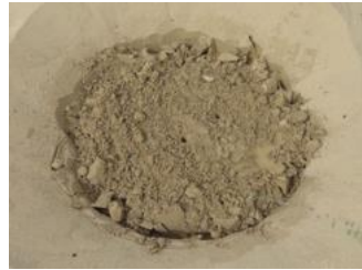
17. Bepaal het ontwerp van de plantafstand in oost-westrichting