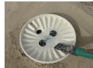
29. Geef indirect 4 liter (1 gallon) water in de midden opening. Zorg dat je de grond bij de wortels van de bomen niet erodeert, door er rechtstreeks water op te gieten.