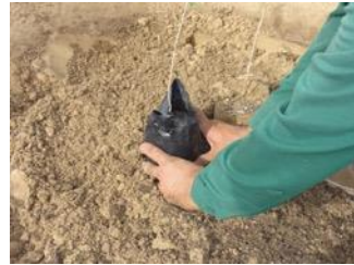
18. Plaats de boom met de zak en neem de zak eraf