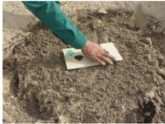
16. Plaats de anti-verdampingsafdekking in oost-westrichting