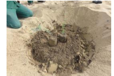
20. U zet de wortels van de planten helemaal in het zand - op deze foto zijn ze geplant boven het zand, dat is verkeerd