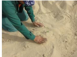
22. Voeg 10 cm (4 inch) grond alleen toe op de anti-verdampingsafdekking voordat u de Waterboxx® plaatst