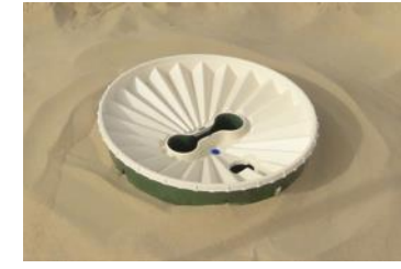
25. Zet de overflow net boven de grond